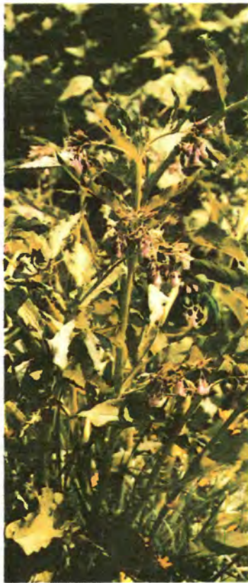
377. Чорнокорінь лікарський.